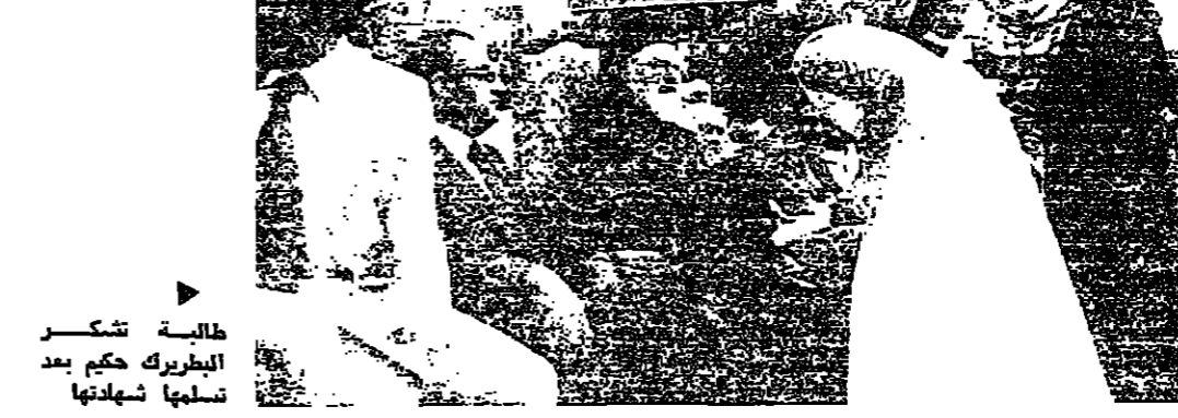
طالبة تشرح البطريق حكيم بعد تسليمها شهادتها

وتسائل البطريق حكيم في كلمته أين كنا ، وأين صرنا ؟ في العام الماضي كنا في حزن ، والى ، وحرب ، والان نحن نتمتع في رحاب هذه المدرسة بهذه المساحة الجميلة ويخيل الي ان اول من يجب ان اشكر هو الله سبحانه وتعالى الذي من علينا بعودة الهدوء والسلام ، فوجب علينا ان نعود لتعيش معا بايمان و سلام . حافظنا امد